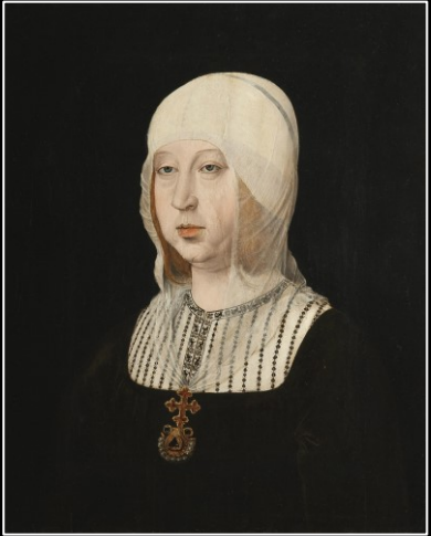
ISABEL I de Castilla