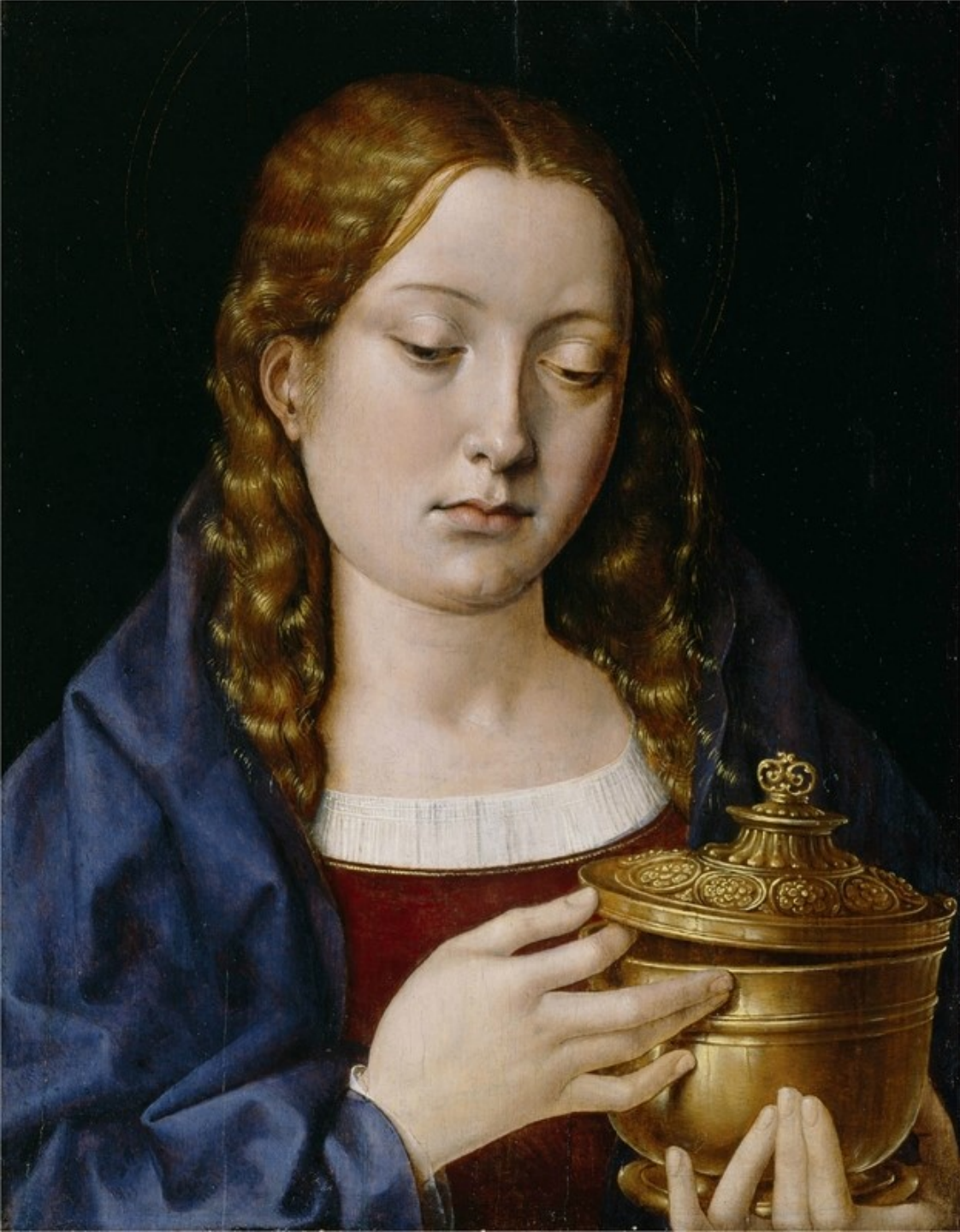
Michel Sittow, Catalina de Aragón como la Magdalena , c. 1515, óleo sobre panel de roble, total: 32,1 x 24,6 cm, Detroit Institute of Art