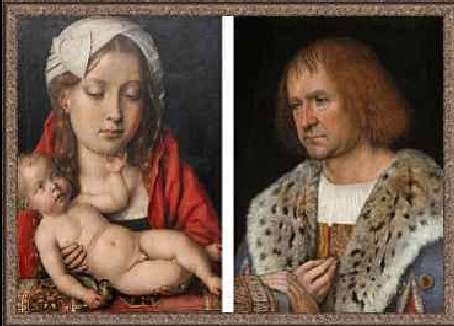
Díptico Madonna y el Niño, Diego de Guevara. de Michael Sittow 1515

La Virgen y el Niño de Sittow Berlin que estaba en un díptico con el retrato de Guevara