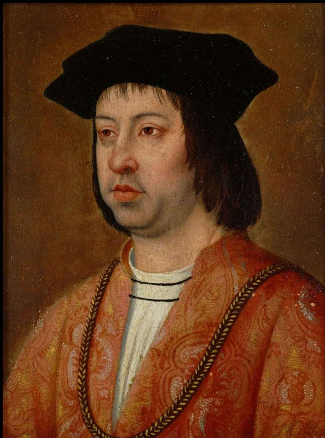
FERNANDO II DE ARAGÓN Michel Sittow ¿?

28,7 cm × 22 cm Kunsthistorisches Museum, Viena