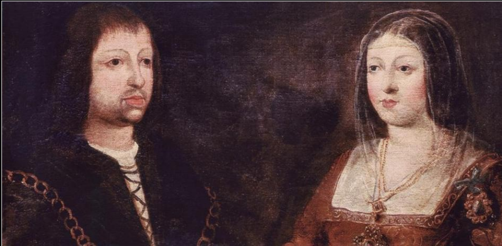
Retrato de Fernando II de Aragón e Isabel I de Castilla

Monasterio de MM. Agustinas de Ntra. Sra. De Gracia, Palacio Real de Don Juan II y casa natal de Isabel la