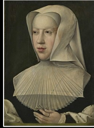
JUAN Príncipe de Asturias