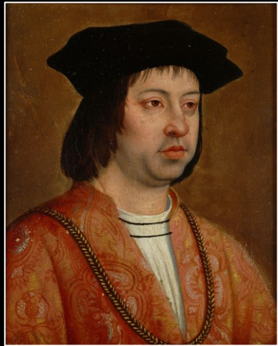
FERNANDO II de Aragón