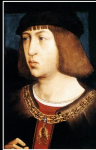
JUANA I Reina de Castilla y Aragón