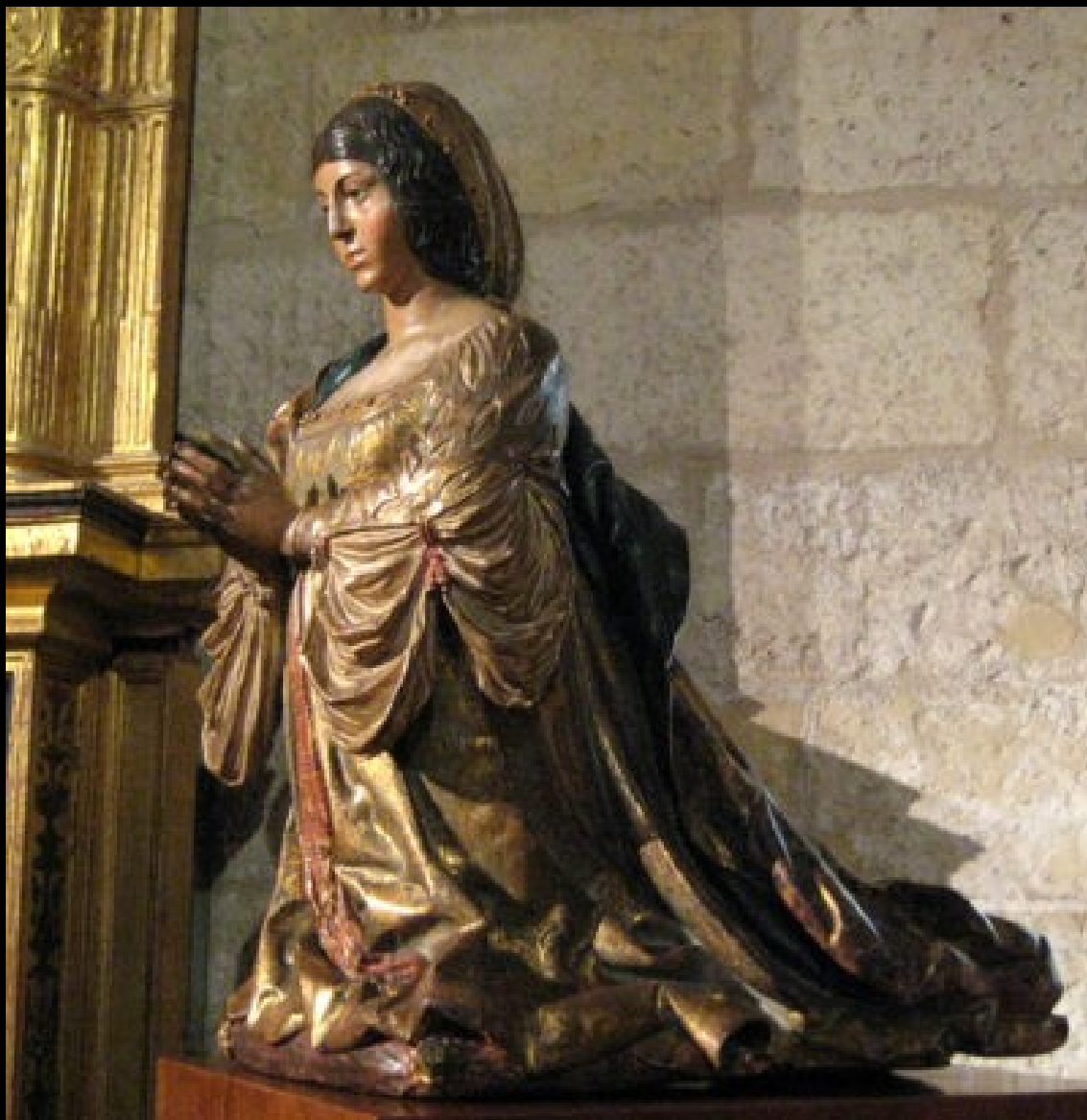
ISABEL LA CATÓLICA Felipe Bigarny, Capilla Real Granada

El poeta Gómez Manrique (1412-1490) dirige estos versos a la Reina :